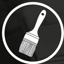
Pensseli ja lisävarsi